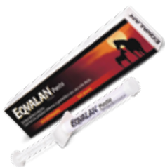
Presentación 6,42 g

Es un antiparasitario oral para equinos para el tratamiento y control de parásitos internos y gastrófilos con una sola dosis.