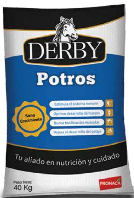
Presentación 40 kg

DERBY POTROS: La alimentación del potro durante los primeros años de vida es de gran importancia y es uno de los factores determinantes de su desempeño en la etapa adulta.