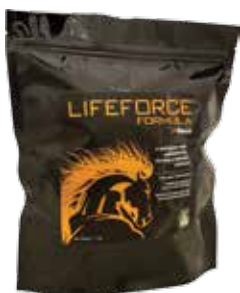
Presentación 1,7 kg

Promueve la salud digestiva general, optimiza el rendimiento, y adsorbe las micotoxinas que afectan la salud, el desempeño y la fertilidad del caballo.