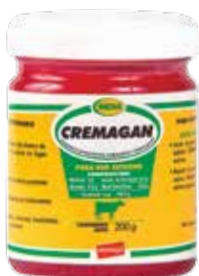
Presentación 200 g

Es un coadyuvante en procesos inflamatorios, funciona como un antiflogístico (sirve para calmar la inflamación).