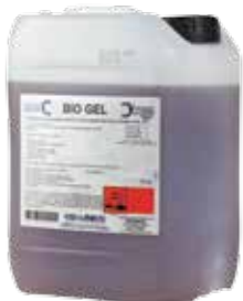
Presentación 10 kg y 25 kg

Producto detergente alcalino fuerte no clorado.