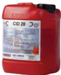
Presentación 1 l, 5 l, 25 l y 200 l

Para limpiar y evitar la presencia de bacterias y virus. Desinfectante de amplio espectro.