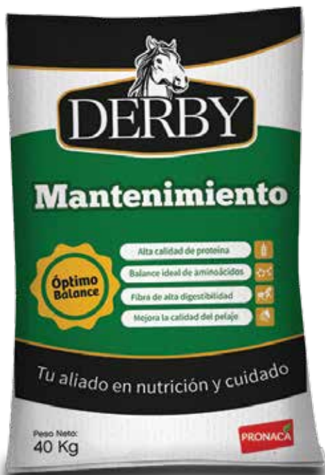
Presentación 40 kg

DERBY MANTENIMIENTO: Es un alimento para caballos en edad adulta que no están siendo sometidos a trabajo.