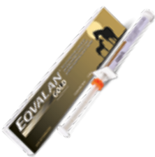
Presentación 7,74 g

Es un antiparasitario oral para el tratamiento y control de parásitos redondos, tenias y otros parásitos importantes en équidos con sólo una dosis.