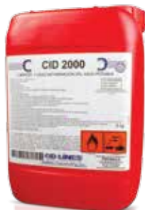
Presentación 5 kg