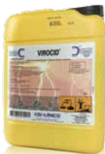
Presentación 5 l

Para desinfectar y evitar la presencia de bacterias, hongos y virus.