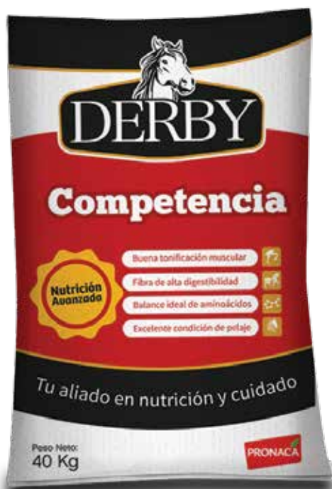
Presentación 40 kg

DERBY COMPETENCIA: Contiene el balance ideal de aminoácidos para caballos adultos de alto rendimiento durante las etapas de mayor actividad física.