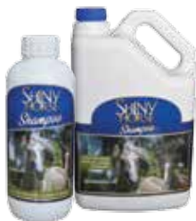
Presentación 1 l y 1 gal